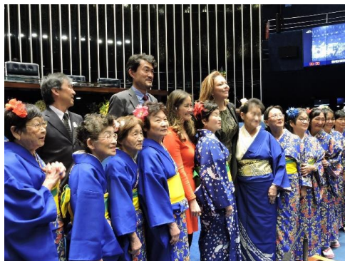
日系関係者との記念撮影

6月11日と7月8日、ブラジリア連邦下院及び上院本会議場にて、「日本人移住 111 周年特別セッション」と題する式典が開催されました。上院にはセシリア・イシタニ伯外務省日本・朝鮮半島・太平洋局長、ブラジル中西部日伯協会連合会長ルイス・ニシカワ氏が、下院にはルイス・ニシモリ議員、キン・カタギリ議員らが登壇しました。日本側は両日とも山田大使、佐藤所長が登壇し、上院では約 120 名、下院では約 300 名が来場しました。