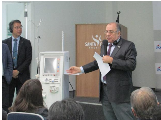
サンタクルス病院院長による本邦企業製品紹介

2019年7月31日、サンタクルス病院主催、JICA協力にて「第3回日系病院連携協議会」を開催しました。参加者は、サンタクルス病院、サンパウロ日伯援護協会・日伯友好病院、アマゾニア病院、杉沢病院、ノーボ・アチバイア病院の理事長・理事、栄養士を中心とした日系病院代表者、日本から九州大学と大阪大学の代表者、在サンパウロ日本国総領事館、本邦企業ら約80名に上りました。