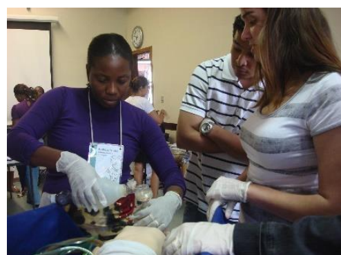
人間的出産の研修