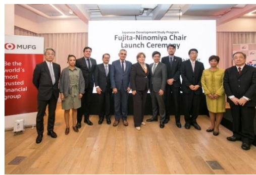
主要関係者による記念撮影

「MUFGバンク＝ブラジル進出100周年＝藤田・二宮USP講座に寄付＝日伯関係者がJHで記念式典」