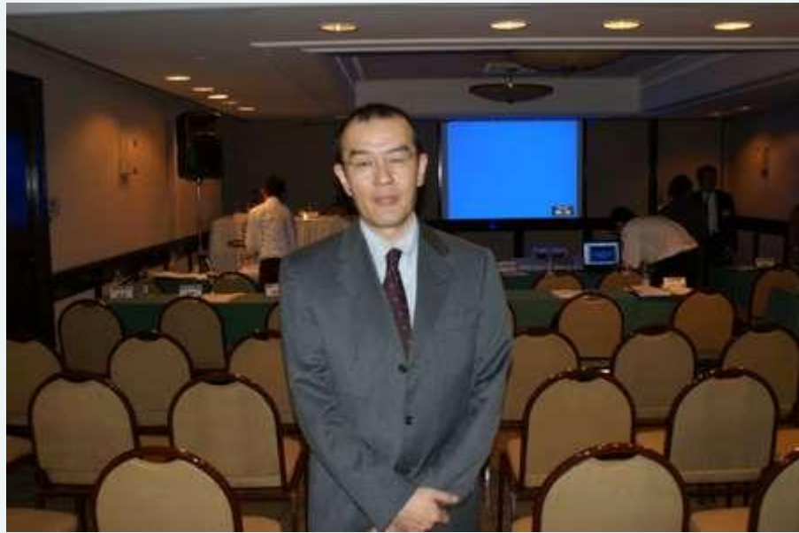
佐々木光前委員長 (2010年6月まで)